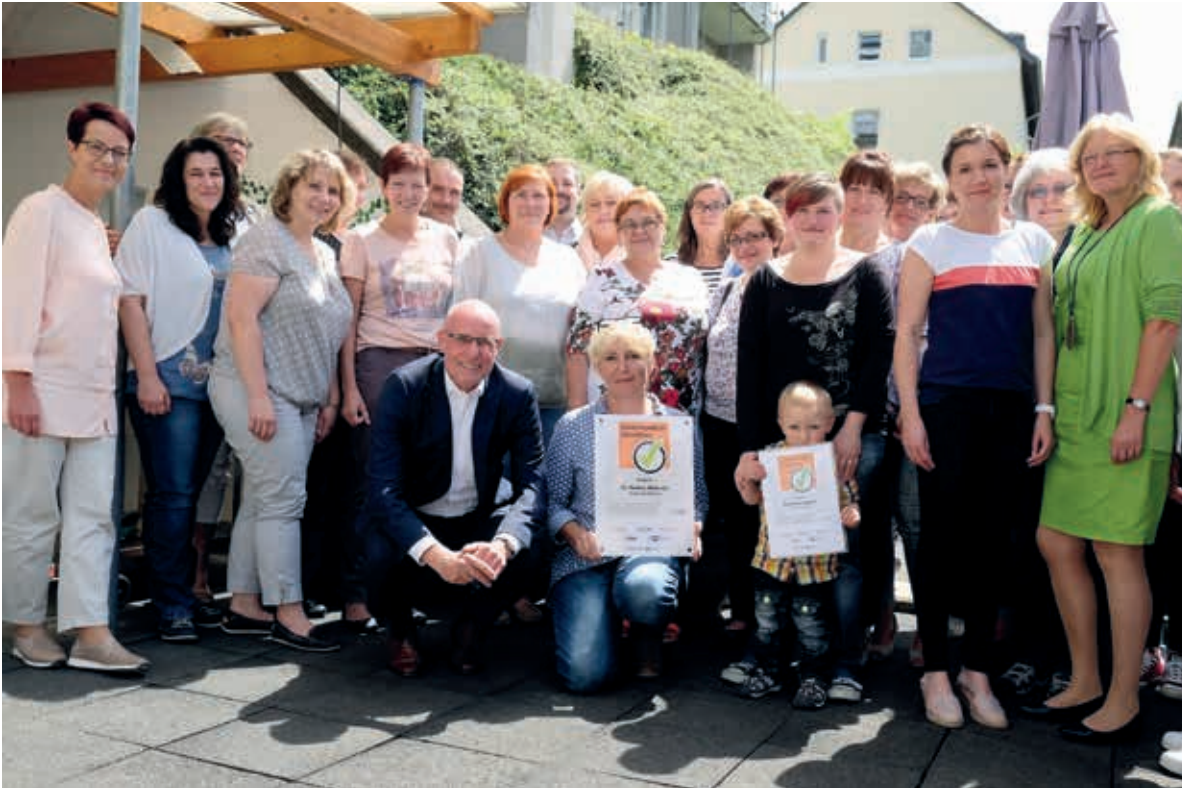
Strahlende Gesichter nach erfolgreicher Re-Zertifizierung: In Schwelm fand die erneute Verleihung des Zertifikats „Familienfreundliches Unternehmen“ an den Geschäftsbereich Perthes-Altenhilfe Süd statt.

Das Kompetenzzentrum Frau & Beruf Märkische Region hat im Zeitraum März/April drei Impulsworkshops angeboten, an denen immer mindestens drei Einrichtungsleitungen teilgenommen haben. In den Impulsworkshops wurden Themen bearbeitet wie Kommunikation oder Arbeitszeitgestaltung.