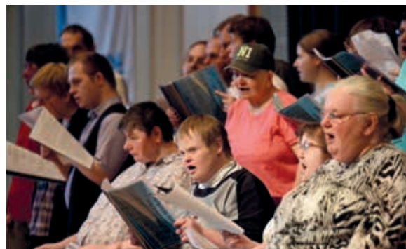
Der Chor der Börde-Werkstätten erfreute mit seinen Liedern die prall gefüllte Kamener Stadthalle.