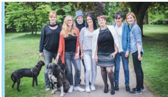
„Portraits für das Selbstbewusstsein“: Es gehört einiges dazu, sich vor eine Kamera zu stellen, Vertrauen zu entwickeln, authentisch zu sein, ein sicheres Auftreten vor der Kamera zu erlangen und im Mittelpunkt zu stehen. Klienten des Ambulant Betreuten Wohnens in Hamm bekamen die Chance, Portraitfotos von sich aufnehmen zu lassen.