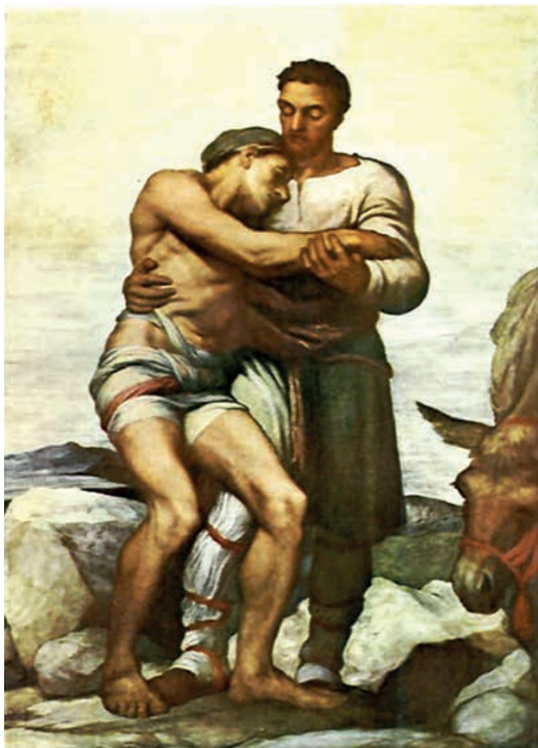
George Frederic Watts: Der barmherzige Samariter

Wenn Sie an diesen Fundstücken Interesse haben, finden Sie Weiteres auf diesen Seiten, die auch die Quellen des vorangegangenen Beitrags darstellen: